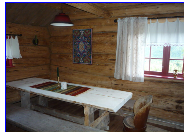
Inne i sovehytta...

Ein førjulskveld i julestria, kva er vel betre å sitje ute i godt varmt vatn, drikke julegløgg og slappe av saman med gode naboar og venner.